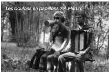
Les boulons en papillons

12h15 La Bouline (chants de marins) 14h Stevan Vincendeau (traditionnel sans frontières) 15h45 June Bug (électronic rock lo-fi fuzz folk)