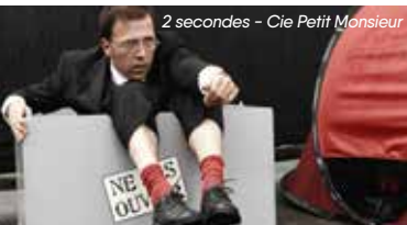
2 secondes - Cie Petit Monsieur