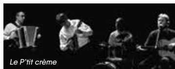
Le P'tit crème