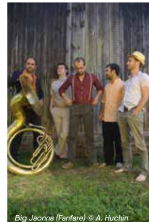
Big Joanna (Fanfare) © A. Huchin