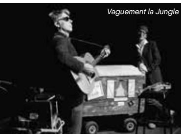
Vaguement la Jungle