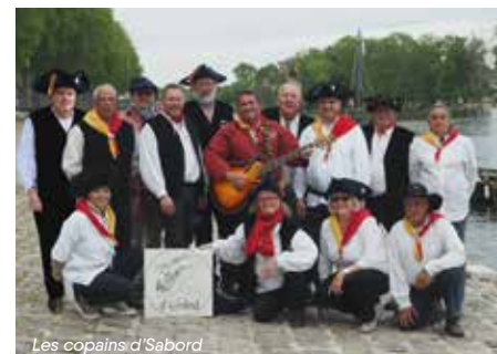
Les copains d'Sabord

17h15 et 18h30 Les Copains d'Sabord (chants de marins)