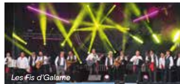
Les Fis d'Galarné

11h30 Big Joanna (fanfare) 15h15 et 16h30 La Bouline (chants de marins)